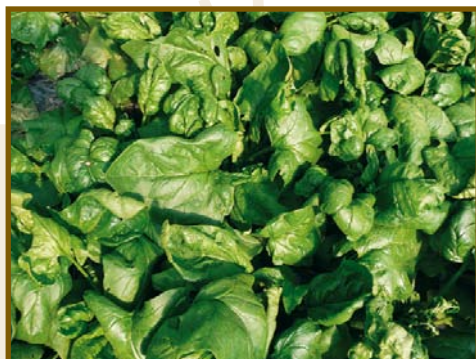
Photos 15 et 16 : Variétés d'épinard Tarp et Été de Reuil à la récolte