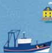
ÎLE DE SAIN