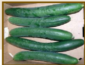
Arola (type épineux)

Seules 7 des 10 variétés évaluées correspondent effectivement au type variétal hollandais : Aramon, Bowling, Tyria, Palladium, Flamingo, Airbus, et Rollisson's Telegraph. Arola et Helena sont des concombres longs et épineux ; Paska produit des fruits courts et lisses, comme le montrent les photographies ci-dessous.