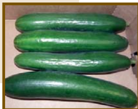
Paska (Type court)