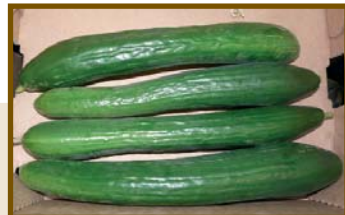
Airbus (type Hollandais)

Différents types variétaux de concombre évalués par la P.A.I.S.