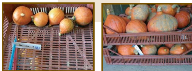
Récolte pour la modalité "sol nu" (à gauche) et pour la modalité "paillage poly-éthylène"

La modalité "sol nu" a été rapidement colonisée par de nombreuses adventices. Le temps de travail nécessaire à la maîtrise de leur développement s'est avéré très important, et les interventions sont rapidement devenues difficiles à réaliser une fois que la culture avait atteint un certain développement végétatif (risques de casse de plants). La concurrence des adventices pour l'eau et la lumière a fortement limité la productivité de la modalité "sol nu", dont le rendement a atteint 1 t/ha, avec une grande majorité de petits fruits (cf. photos ci-dessous).