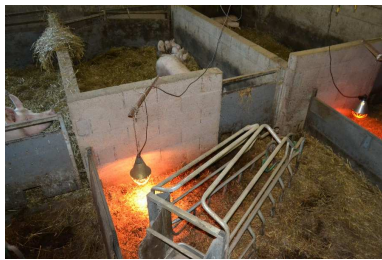
Journée IBB – 16 Juin 2016